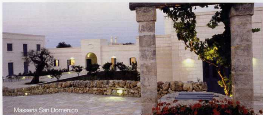
Masseria San Domenico

all'arrivo, massaggi rilassanti e tanti altri magnifici trattamenti, (oltre a consentire il libero accesso a sauna, bagno turco, palestra, docce cromate aromatiche e percorsi kneipp), il tutto all'interno di una delle migliori Spa della penisola, eletta Leading Spa nel 2005.